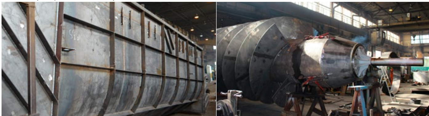
Fot. 4 Produkcja śruby Archimedes, od lewej: zabudowa samonośna, wirnik

ok. 16 ton. Koryto przenosi na płyty żelbetowe całość obciążeń zarówno z wirnika (siła promieniowa ok. 5 ton, siła osiowa ok. 11 ton), siły wynikające z momentu obrotowego (ok. 14 000 Nm), jak również w sposób ciągły przenosi ciężar wody wypełniającej turbinę (ok. 10 ton) oraz siły związane z utrzymaniem otwartej zastawki, a także masę własną. W związku z czym mamy skomplikowany układ obciążeń, a tym samym i odkształceń. Jednocześnie należy pamiętać, że szczelina pomiędzy