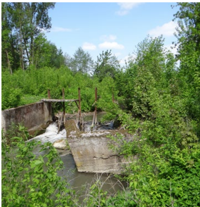
Fot. 2 Przepławka podczas budowy MEW pełniła rolę kanału obiegowego