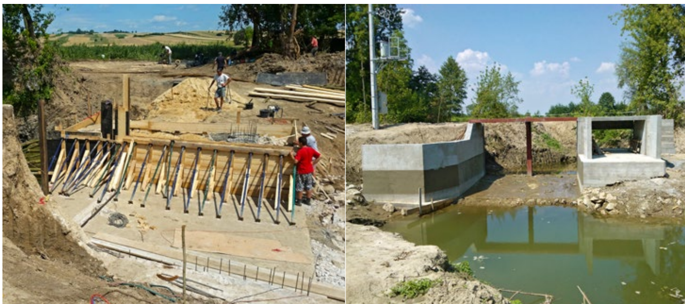
Fot. 3 Od lewej: deskowanie pionowych ścian kanału napływowego, jaz po ukończeniu betonowania